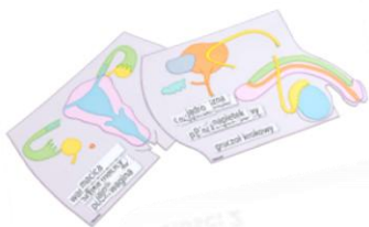
Nagroda nr: PL11-C00016 Tablice magnetyczne – układ rozrodczy 300 Talenciaków Ilość: 1