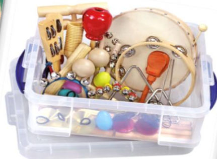
Nagroda nr: PL11-C00011 Pudełko z instrumentami 750 Talenciaków