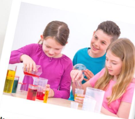
Nagroda nr: PL11-C00024 Zestaw do eksperymentów – objętość 700 Talenciaków Ilość: 1