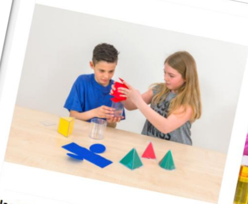
Nagroda nr: PL11-C00025 Zestaw brył 250 Talenciaków Ilość: 2