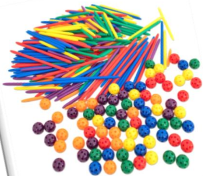
Nagroda nr: PL11-C00030 Zestaw do nauki geometrii 300 Talenciaków