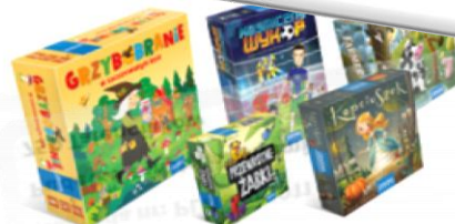
Nagroda nr: PL11-C00089 Pakiet planszówek dla najmłodszych 300 Talenciaków