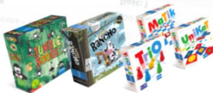
Nagroda nr: PL11-C00090 Pakiet planszówek dla nieco starszych 400 Talenciaków