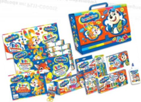
Nagroda nr: PL11-C00084 3 zestawy plastyczne „Mały artysta” 400 Talenciaków